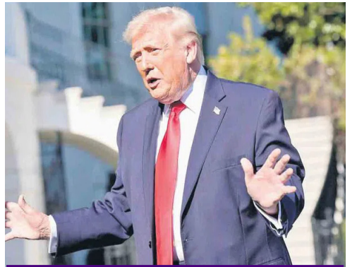
పెరుజ్జీను దిగ్భంజిస్తాం.. ఇరాన్ తో చర్చలు విఫలం కావడంతో ట్రంప్ హెచ్చరిక