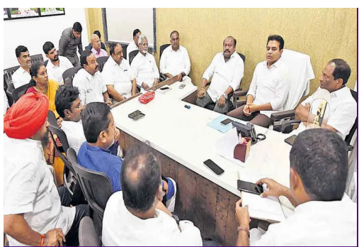
జగిత్యాల సభను జయప్రదం చేయాలి

పచురణ: హైదరాబాద్, తెలంగాణ సంపుటి: 01 సంచిక: 156 ఎడిటర్: యం ఈశ్వరయ్య పేజులు: 08, సోమవారం 13-04-2026 సెల్: 9440912389, 9490315559 వెల రూ. 2 రూ/