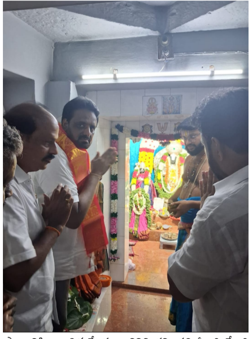
ప్రాంతానికి ఆధ్యాత్మిక కేంద్రంగా నిలిచిందని, ప్రతి ఏడాది వేలాది మంది భక్తులు స్వామివారి దర్శనం కోసం తరలివస్తారని