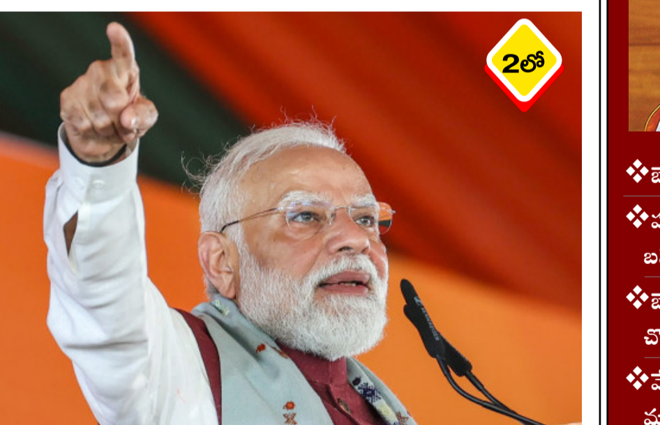
పశ్చిమ బెంగాల్ లో అధికార తృణమూల రాష్ట్రంలోని మహిళలు, యువత చురుకైన పోరాటాన్ని కాంగ్రెస్ కు వ్యతిరేకంగా దండెత్తింది బీజేపీ కాదని... ప్రారంభించారని ప్రధానమంత్రి