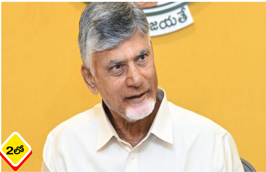
అమరావతి రాజధాని కోసం భూములిచ్చిన రైతులకు అంద్రప్రదేశ్ ప్రభుత్వం శుభవార్త అందించింది. వారి జీవనోపాధికి భరోసా కల్పిస్తూ వార్షిక కౌలును గణనీయంగా పెంచుతూ కీలక నిర్ణయం