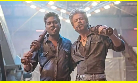
టాలీవుడ్ ట్విస్ట్ కూడా పూర్తి చేయగా.. షారుఖ్ ఖాన్ ఆ ట్విస్ట్ విని గ్రీన్ సిగ్నల్ ఇచ్చినట్లు సమాచారం. ప్రస్తుతం అద్దీ - అల్లు అర్జున్ తో రాజా సినిమా చేస్తున్నారు. అలాగే షారుఖ్ ఖాన్ కింగ్ సినిమా కూడా బిజీగా ఉన్నారు. అన్నీ పూర్తయ్యాక ఈ సినిమా పెట్టాలెత్తునుంది. ప్రస్తుతం ఈ సినిమా ట్రై ప్రాడక్షన్ పనుల్లో బిజీగా ఉన్నట్లు సమాచారం. ఒకవేళ సాత్ సూపర్ స్టార్ ఎవరైనా విలన్ గా నటిస్తే, ఈ సినిమా కలెక్షన్ల పరంగా మరో దరిత్ర సృష్టించడం ఖాయం. ప్రస్తుతం ఇవన్నీ చర్చల దశలోనే ఉన్నప్పటికీ, షారుఖ్ ఖాన్ లాంటి స్టార్ హీరో సినిమా అంటే అంచనాలు సహజమే. అద్దీ ఈసారి ఎలాంటి మాన్ ట్విస్ట్ లు షాన్ చేస్తున్నారో, ఆ సాత్ హీరో ఎవరో తెలియాలంటే అధికారిక ప్రకటన వచ్చే వరకు ఆగాల్సిందే.