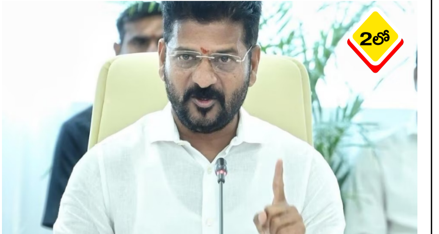
మేడే వేళ తెలంగాణ ఆర్టీసీ కార్మికులకు సీఎం రేవంత్ రెడ్డి మరో శుభవార్త!.. దేశ వ్యాప్తంగా ఎక్కడ చూసిన మేడే సంబరాలు అంటరాని తాకాయి. ఈ క్రమంలో తెలంగాణలో కూడా