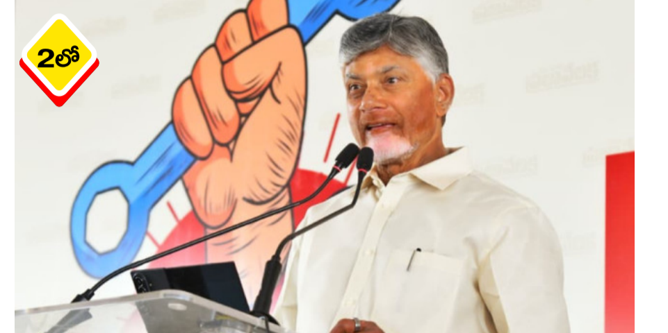
అంతర్జాతీయ కార్మిక దినోత్సవం (మేడే) సందర్భంగా కృష్ణా జిల్లా పమిడిమొక్కలలో ఏర్పాటు చేసిన 'ప్రజా వేదిక' సభలో ముఖ్యమంత్రి పాల్గొన్నారు. ఈ సందర్భంగా ఆయన వైసీపీపై తీవ్రస్థాయిలో