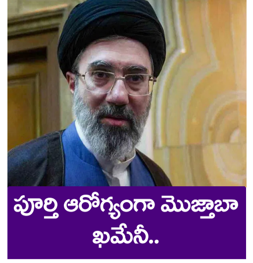
పూర్తి ఆరోగ్యంగా మొజ్తాబా ఖమేనీ..