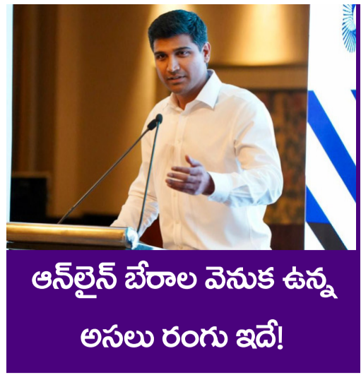
ఆన్లైన్ బేరాల వెనుక ఉన్న అసలు రంగు ఇదే!