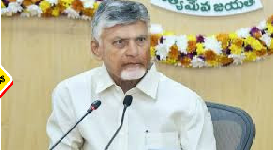
ట్రాన్స్ జెండర్ల సంక్షేమం, హక్కుల పరిరక్షణకు ఆంధ్రప్రదేశ్ ప్రభుత్వం మరో కీలక నిర్ణయం తీసుకుంది. ట్రాన్స్ జెండర్ల పర్సన్ స్టేట్ వెల్ఫేర్ బోర్డుకు కొత్త సభ్యులను నియమిస్తూ చంద్రబాబు సర్కార్ ఉత్తర్వులు జారీ చేసింది. ట్రాన్స్ జెండర్ల సంక్షేమం, హక్కుల పరిరక్షణకు ఆంధ్రప్రదేశ్ ప్రభుత్వం మరో కీలక నిర్ణయం తీసుకుంది.

తిరుమలలో తగ్గిన భక్తుల రద్దీ ★ 22 కంపార్టుమెంట్లలో వేచి ఉన్న భక్తులు ★ సర్వదర్శనం కోసం వచ్చిన వారికి 8 గంటల్లో కలుగుతున్న దర్శనం ★ రూ. 300 టికెట్లు ఉన్న వారికి 4 గంటల్లో దర్శనం