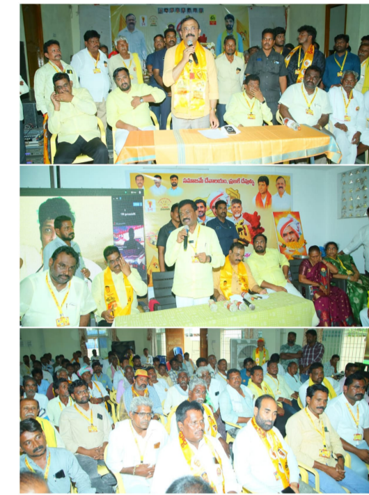
హాజరయ్యార అనంతరం ప్రత్యేక విందు కార్యక్రమం నిర్వహించారు