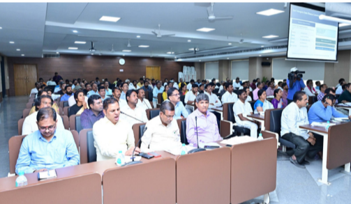
జీవన ప్రమాణాల మెరుగుదల కోసం శాస్త్రీయ దృక్పథంతో పని చేయాలని మార్గనిర్దేశం చేశారు. చైతన్యవంతమైన సమాజ నిర్మాణం జరిగి, అన్ని వర్గాల వారు అభివృద్ధి పథంలో ముందుకు సాగాలన్నదే ఆర్థిక సంఘం ధ్యేయమని చైర్మన్ స్పష్టం చేశారు. ఆర్థిక అసమానతలు, సామాజిక వ్యత్యాసాలు సమసిపోయి, మానవ సంపద, వారి శక్తిమత్తులు సమాజానికి ఉపయోగపడేలా కృషి జరగాలన్నారు. ఈ దిశగా ప్రజలకు, ప్రభుత్వానికి కమిషన్ వారధిగా నిలుస్తూ సామాజిక అభ్యుత్థి కోసం చేపట్టాల్సిన చర్యలపై ప్రభుత్వానికి నివేదిక రూపంలో ఫైనాన్స్ కమిషన్ సూచనలు చేస్తుందని తెలిపారు. అన్ని గ్రామ పంచాయతీలు, మున్సిపల్ వార్డులలో ప్రతి నివాస గృహానికి రక్షిత మంచినీరు సరఫరా జరిగిలా,