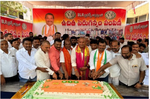
పట్టణంలోని పలు ప్రాంతాల్లో అన్నదాన కార్యక్రమాలు, రోగులకు వంద వంటి వేడుకలు.. ఈ వేడుకల్లో స్థానిక మున్సిపల్ చైర్మన్, కౌన్సిలర్లు, మండల పార్టీ అధ్యక్షులు, కాంగ్రెస్ పార్టీ సీనియర్ నాయకులు మరియు భారీ ఎత్తున అభిమానులు