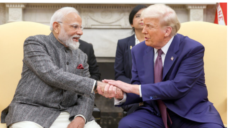
పశ్చిమ బెంగాల్ శాసనసభ ఎన్నికల్లో బీజేపీ ఈ అపూర్వ గెలుపుపై ప్రధాని నరేంద్ర మోదీకి చరిత్రాత్మక, నిర్ణయాత్మక విజయం సాధించింది. ఆమెరికా అధ్యక్షుడు - మిగతా 2 లో