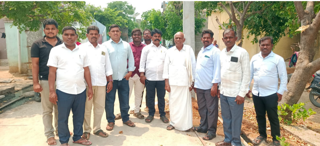
వెప్పడం లేదని వారు తెలిపారు. దగ్గర కాలనీలో కరెంట్ పోల్చే ను సరైన క్రమంలో నాలుకుండా ఇష్టారాజ్యంగా నాలుకుం సమంజసం కాదని వారన్నారు. దగ్గర కాలనీలో పోల్చే అడ్డంకంగా నాలుకుం పనిచేసే సూపర్వైజర్, డిలీవర్ అడిగిన వినిపించుకోవడం లేదని వారు తెలిపారు. భవిష్యత్తులో ఇల్లు నిర్మాణం ఎలా చేసుకోవాలి, సచ్చినట్లు కరెంటు పోల్చే నాలుకుంటూ వెళ్లారు మీ ఇంటి దగ్గర