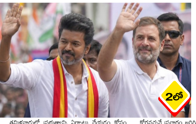
తమిళనాడులో ప్రభుత్వాన్ని ఏర్పాటు చేయడం కోసం కోరవచ్చనే ప్రచారం జరిగింది. తాజాగా

విజయ్ నేతృత్వంలోని టీవీకే పార్టీ తమ మద్దతును కోరిందిని కాంగ్రెస్ పార్టీ సీనియర్ నేత కేసీ వేణుగోపాల్ తెలిపారు. 234 స్థానాలున్న తమిళనాడు అసెంబ్లీలో ప్రభుత్వాన్ని ఏర్పాటు చేయడానికి కావాల్సిన బలం 118. టీవీకే 108 సీట్లు సాధించినప్పటికీ, మరో పదిమంది ఎమ్మెల్యేల అవసరం ఉంది. ఈ క్రమంలో డీఎంకే కూటమిలోని కాంగ్రెస్, వీసీకే, వామపక్షాలు మద్దతును టీవీకే